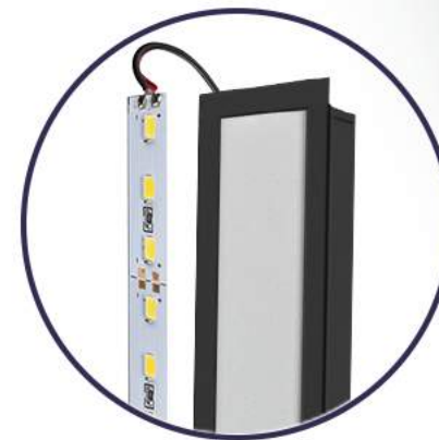
Opção III: Estrutura do perfil e fonte luminosa sem driver.

*Em todos os modelos estão inclusos os acessórios para montagem.