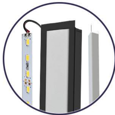
Opção II: Sistema completa com fonte luminosa e driver, pronto para instalar.